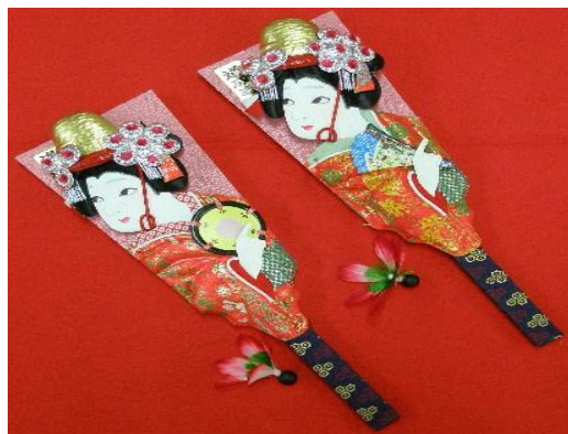
【29】裝飾用羽拍(小) L37 x W11