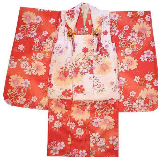
【26】七五三3歲女童用和服組 (展示用)