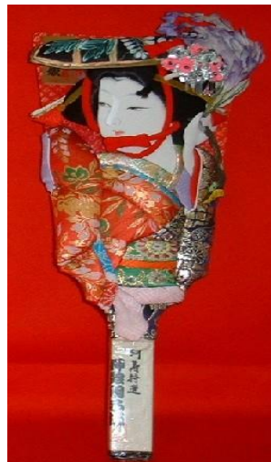
【28】裝飾用羽拍(大) L56 x W23